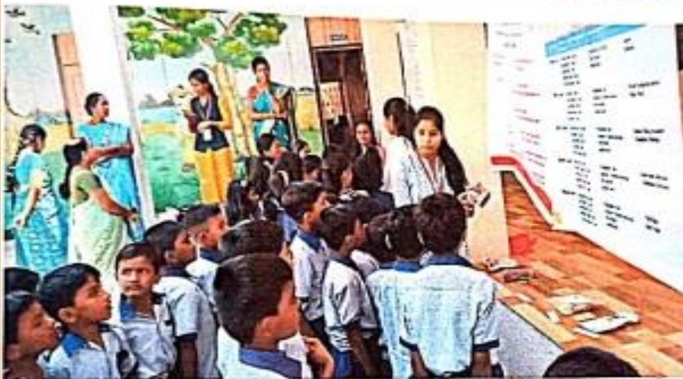
Student of M.Sc II (Botany) detailing about im of Millet to primary school children at Barha