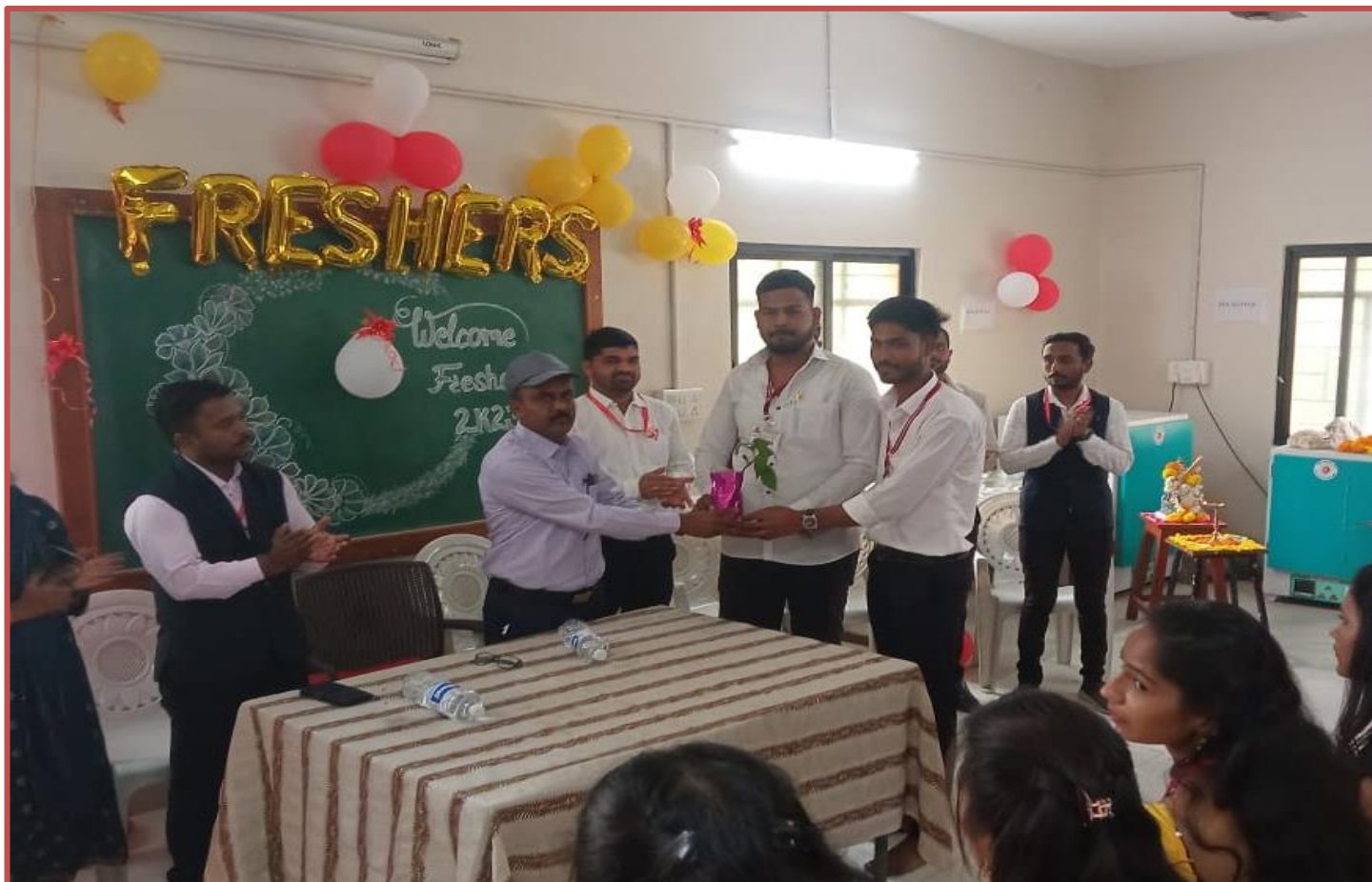
Felicitation of Students in Their Freshers party(16-09-2023)