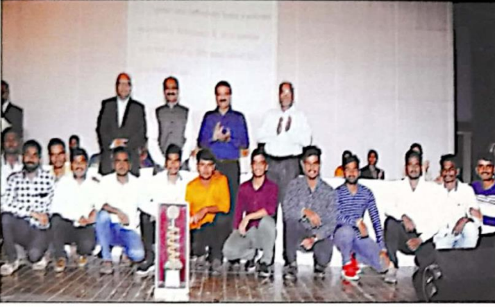
आंतरमहाविद्यालयीन सॉफ्टबॉल (मुले) विजयी संघ व बेसबॉल मुले उपविजयी संघासमवेत मान्यवर