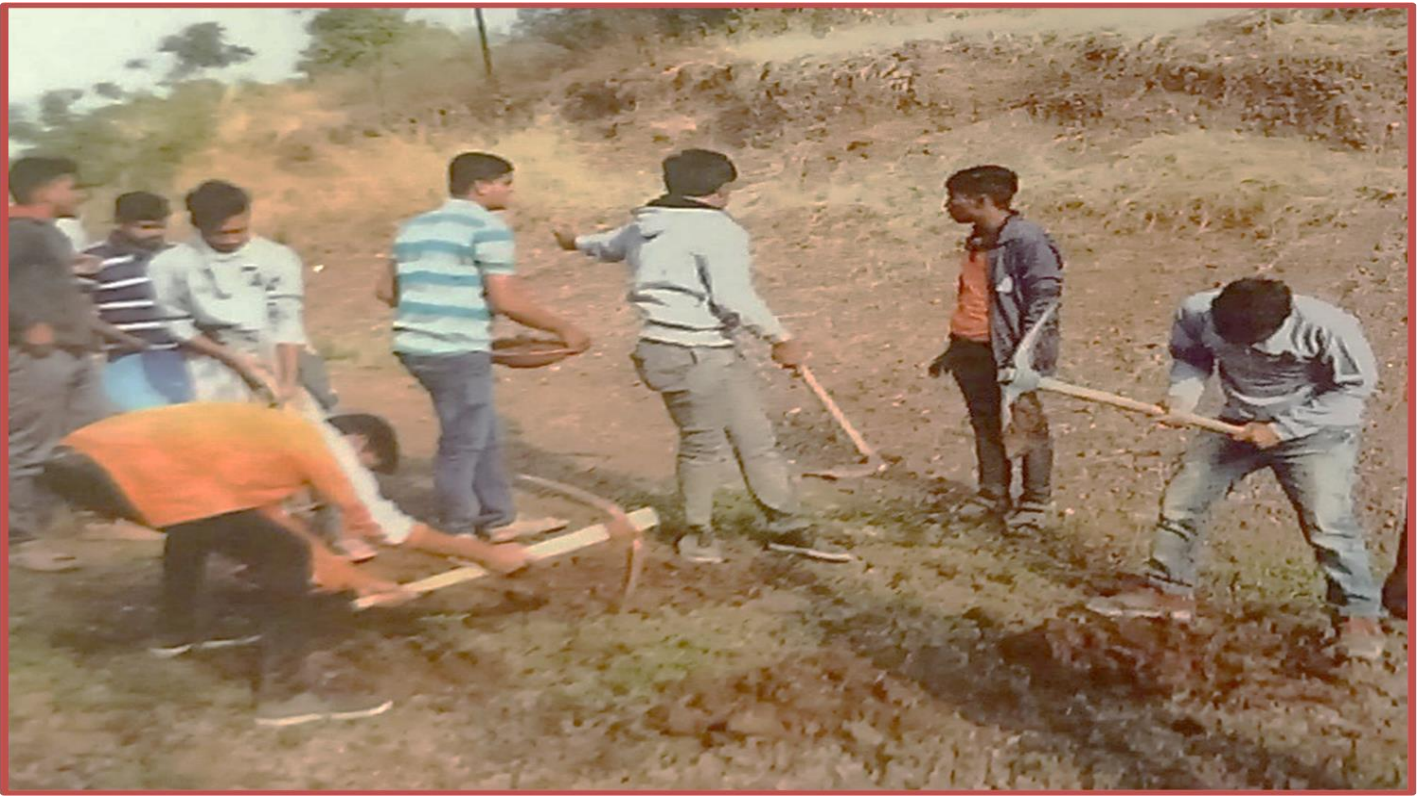
Students Constructing Bunds for Water Conservation at Anjangaon (08/12/2022)