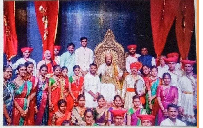
महाराष्ट्र शासन सांस्कृतिक मंत्रालय आयोजित शिवराज्याभिषेक महानाट्यात महाविद्यालयातील सांस्कृतिक विभागातील सहभागी कलाकार