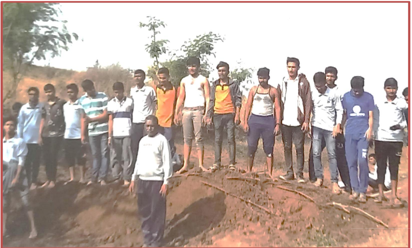
NSS Volunteers Enjoying completion of soil bund (08/12/2022)