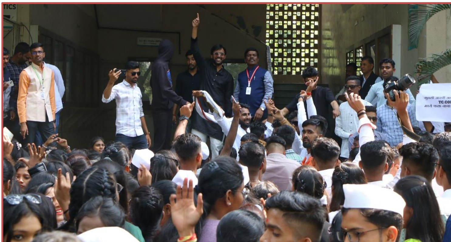
Students Participated in IQAC Yuva Mahotsav