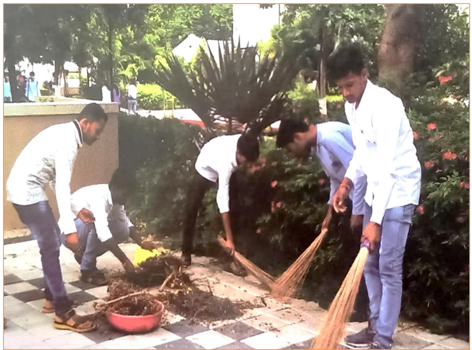
NSS Volunteers Participated in Cleaning Drive in the college campus (21/08/2022)