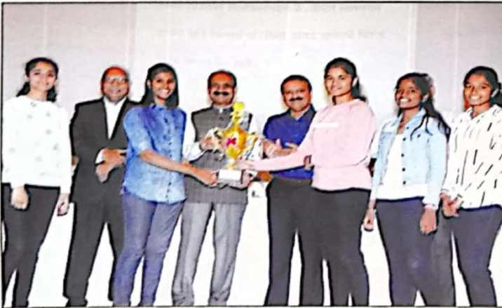
आंतरमहाविद्यालयीन तलवारबाजी स्पर्धेतील मुलींच्या विजयी संघासमवेत मान्यवर