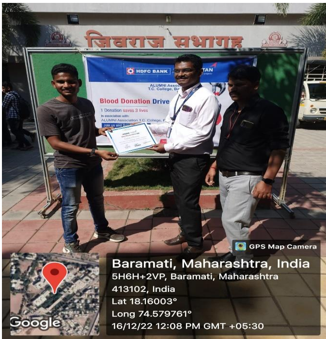
BLOOD Donor Being Felicitated By Giving Certificate