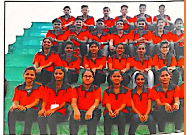
अखिल भारतीय आंतरविद्यापीठ बेसबॉल स्पर्धेतील स्वयंसेवक