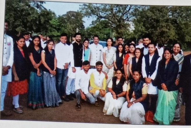
एम.आय.टी. कॉलेज पुणे येथे झालेल्या अभिरूप युवा संसद स्पर्धेत यश संपादन केल्याबद्दल अभिनंदन करताना संसदरत्न मा. खासदार सौ. सुप्रियाताई सुळे