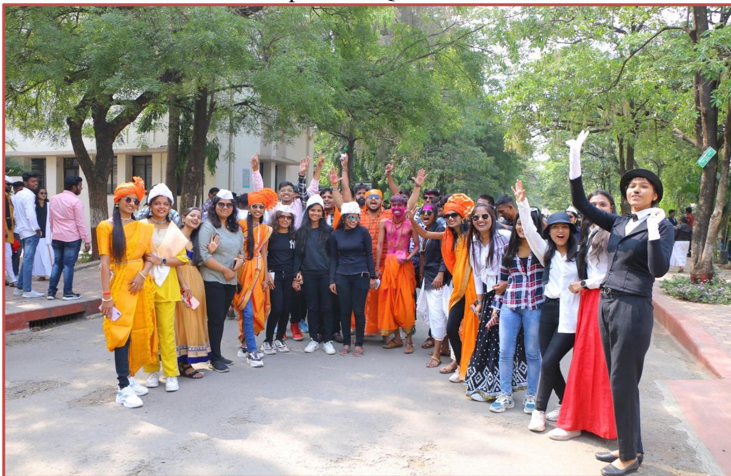
Student Representing in Mismatch Day