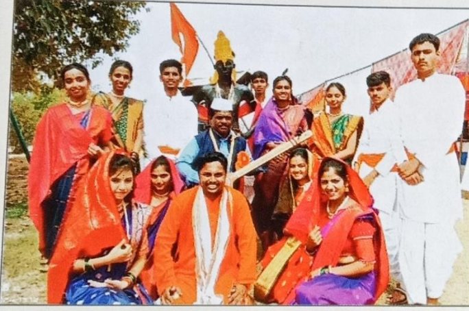
पंजाब येथे झालेल्या राष्ट्रीय युवा सांस्कृतिक महोत्सवातील वारी या गीतातील संघ