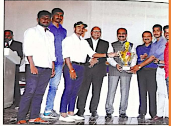
आंतरमहाविद्यालयीन तलवारबाजी स्पर्धेतील मुलांच्या विजयी संघासमवेत मान्यवर