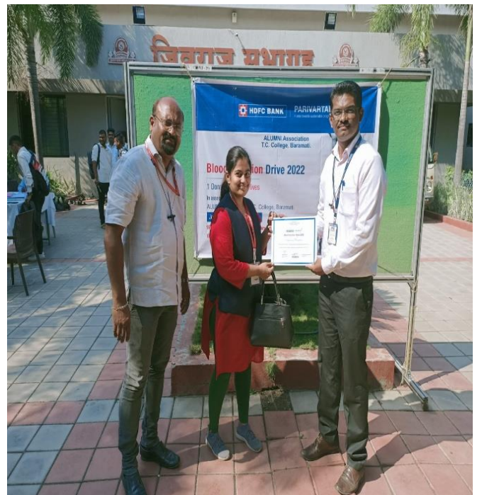
BLOOD Donor Being Felicitated By Giving Certificate