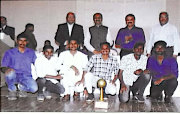
आंतरमहाविद्यालयीन बास्केटबॉल व नेटबॉल (मुले) स्पर्धेतील विजयी संघासमवेत मान्यवर