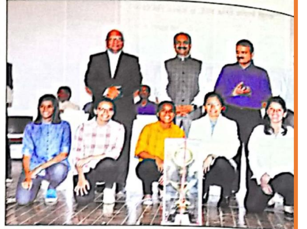
आंतरमहाविद्यालयीन बास्केटबॉल व नेटबॉल (मुली) विजयी संघासमवेत मान्यवर