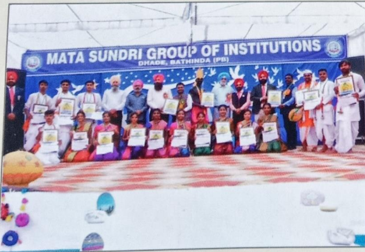
पंजाब येथे झालेल्या राष्ट्रीय युवा सांस्कृतिक महोत्सवामध्ये महाराष्ट्राचे प्रतिनिधित्व करणाऱ्या आपल्या महाविद्यालयास प्रथम क्रमांक मिळाला