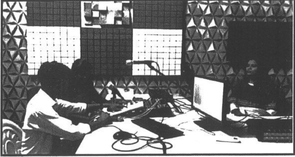
Practical of Radio program production