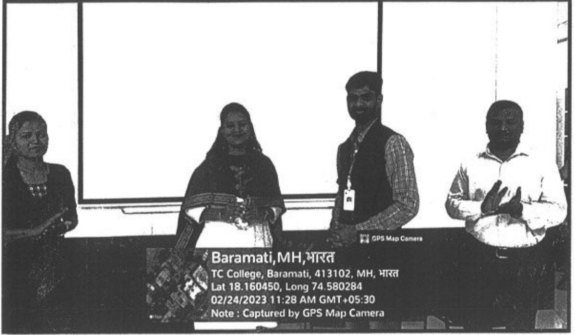
Radio program production inauguration photos