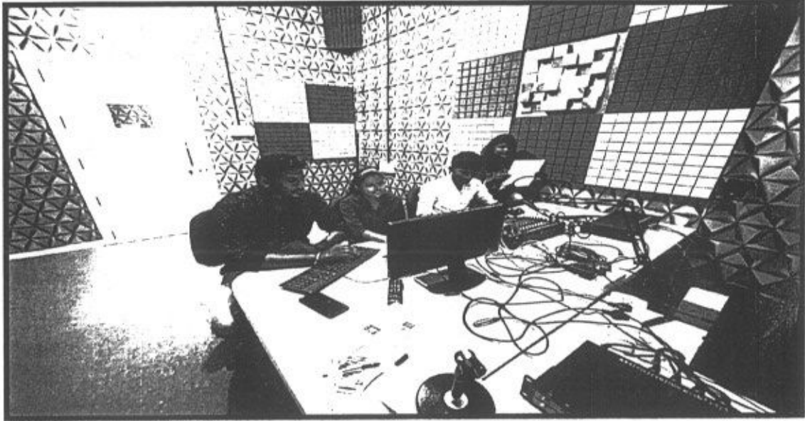
Radio program production script recording and editing activity