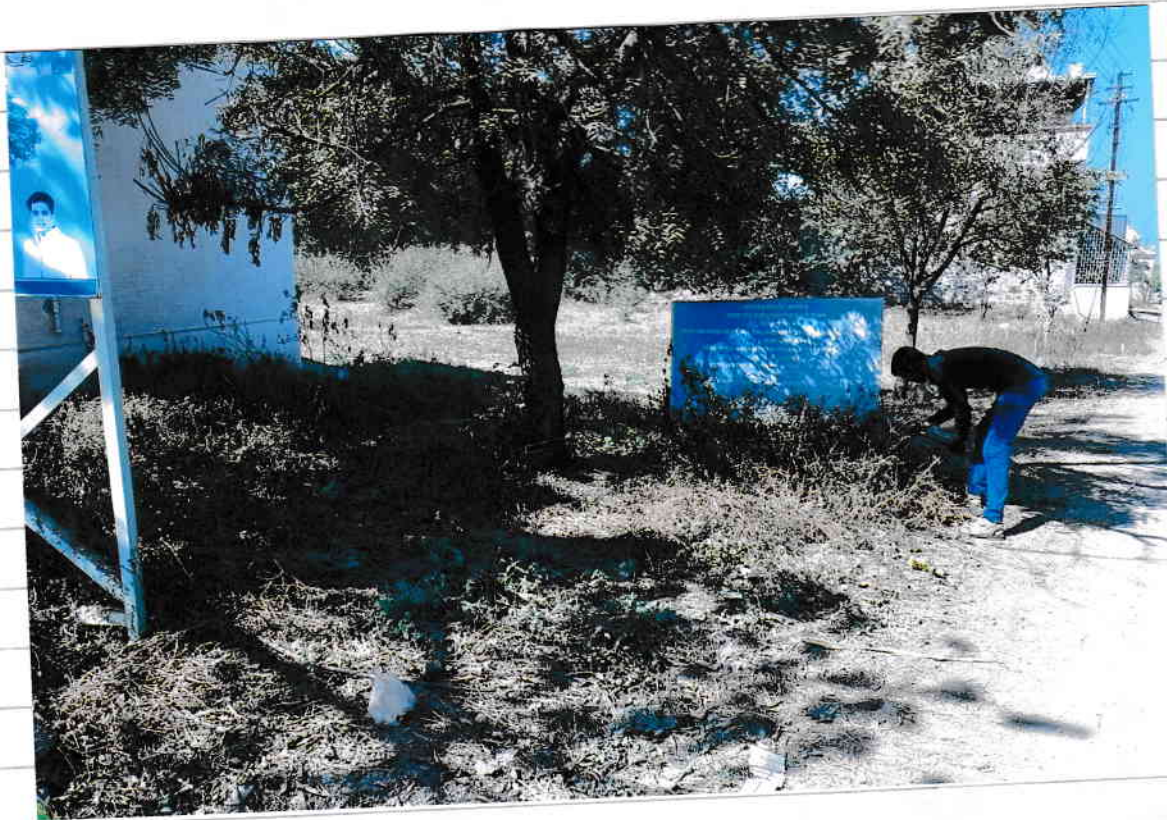
शा. व. लाला