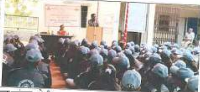
शिबीरकाळात मान्यवरांच्या भेटी