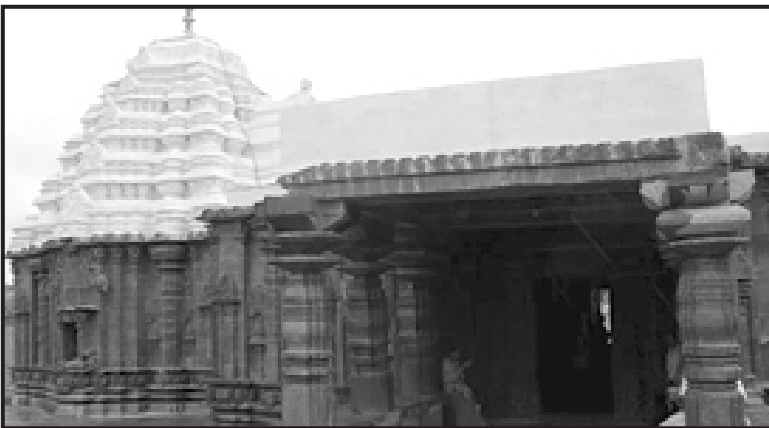
Fig 3. Badami- Chaluky Fig 4. Gadag

The Western Chalukya architecture or Gadag style of architecture is a specific style of decorative architecture that originated from the old dravida style and defines the Karnatadravida tradition. Evolved during 11th century it prospered for around 150 years till 1200 CE during the reign of Western Chalukya Empire in the Tungabhadra region of Karnataka and saw construction of around 50 temples. A distinct feature of this style was articulation. Kasivisvesvara Temple at Lakkundi and Saraswati temple in the temple complex of Trikuteshwara at Gadag are some of the temples that illustrate this style.