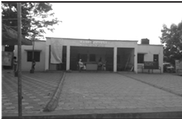
Gram panchayat Office of Ajangoan

In the village there are also the young circle (number: 01), BhajanMandaland (number 02). There are 03 political parties in the town. Many villages in the village are Someshwar Cooperative Sugar Factory - Become Chairman and Director, Taluka Milk Team - Become Chairman, Taluka Bazar Samiti Chairman has been given various posts. Anjangaon is the village of Baramati taluka (Dist. Pune) and has an independent gram panchayat. It was founded in 1956.