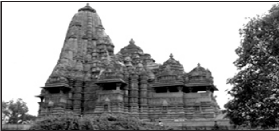
Fig 1. Dravidian