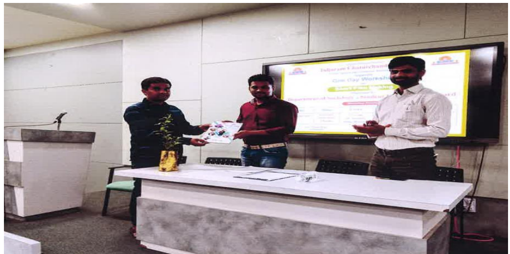
Short Film Making Workshop