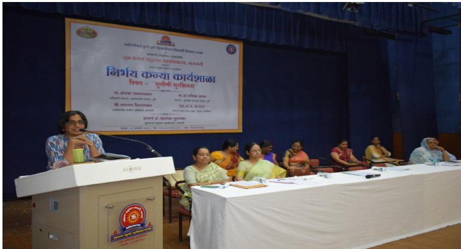
Nirbhay Kanya Workshop